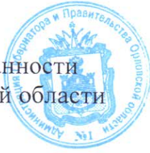
А. Ю. Бударин

Исполняющий обязанности Губернатора Орловской области