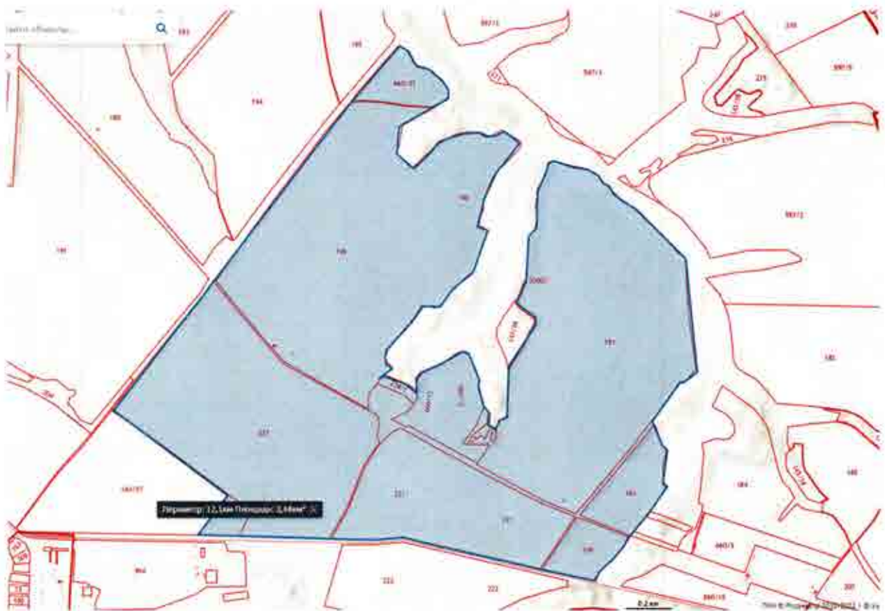
Схема размещения границ карантинной фитосанитарной зоны

(52.893073 36.936561) (52.907285 36.955143) (52.873416 37.042425) (52.855340 37.041639)